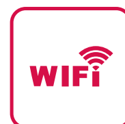
Wi-Fi Control (Optional)